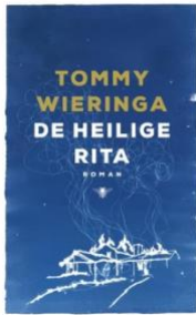
Tommy Wieringa De heilige Rita De Bezige Bij, 2017 304 pagina's

Bijna vijftig jaar woont Paul Krüzen met zijn vader in een Saksische spookboerderij buiten Mariënveen, een vergeten dorp aan de grens. Eens zorgde zijn vader voor hem, nu zorgt hij voor zijn vader. Lang geleden stortte een Russische piloot neer in het maisveld achter hun huis. Dit zette een keten van gebeurtenissen in werking waarvan ze nooit volledig zijn bekomen. Na de Rus kwamen de Chinezen, die het café en de snackbar in het dorp overnamen, daarna volgde de rest van de wereld. Met hen kwam ook de onzekerheid. Het verzet bestaat uit het beschimpen van de Chinezen en de aanschaf van meer bewakingscamera's. Het dorp raakt langzaam uitgestorven, alleen de Chinees, de Happytaria en de ouderwetse kruidenierszaak van Pauls beste vriend Hedwiges zijn over. Van dit dorp en deze mensen is Rita, patrones van de hopeloze gevallen, de beschermheilige. Tommy Wieringa (1967) weet de sfeer in het dorp goed te treffen, evenals de vriendschap tussen Paul en Hedwiges en de stille wanhoop ooit nog iets van hun leven te maken. De tragikomische humor verzacht het realistische beeld van een leven dat veel vijftigplussers die opgroeiden in een klein (Oost-Nederlands) dorp zullen herkennen.