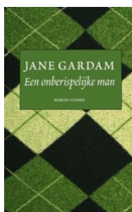
Jane Gardam Een onberispelijke man Cossee, 2017 314 pagina's

De Franse Prix Goncourt winnares Leïla Slimani (1981) heeft net als haar personage Myriam een Noord-Afrikaanse achtergrond. Ze schrijft met Een zachte hand een eigentijds, sociaal drama, met haarscherpe psychologische portretten en een huiveringwekkend plot.