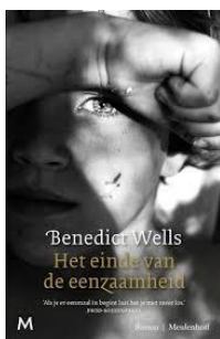
Benedict Wells Het einde van de eenzaamheid Meulenhoff, 2017 304 pagina's

Wanneer Jules Moreau na een ernstig motorongeluk in het ziekenhuis belandt, wordt hij geconfronteerd met herinneringen uit zijn jeugd. Al vroeg verloren Jules, zijn broer Marty en zijn zus Liz hun ouders door een tragisch ongeval. Op hen alle drie laat dit verlies zijn sporen na, en in de jaren die volgen groeien zij gaandeweg uit elkaar. Vooral de eens zo zelfbewuste Jules trekt zich steeds meer in zijn eigen wereld terug. Alleen met de mysterieuze Alva kan hij vriendschap sluiten; jaren later zal hij echter pas begrijpen wat ze voor hem betekent – en wat ze altijd voor hem heeft verzwegen.