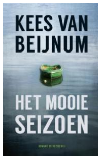
Kees van Beijnum Het mooie seizoen De Bezige Bij, 2017 334 pagina's

Drie personages in Nieuw Sloten, Amsterdam, krijgen te maken met veranderingen in hun leven. Beatrijs werkt als hulpverlener met probleemgezinnen. Omdat zij kans wil maken op promotie tot teammanager is ze niet met haar man meegegaan op een reis naar Zuid-Amerika. Plotseling wordt zij op haar werk geconfronteerd met een vermist kind waarna zij op non-actief wordt gesteld. Haar zestienjarige zoon Arno wordt op school gepest en spijbelt, zonder dat zij dit weet. Omdat Beatrijs nu thuis zit, brengt Arno zijn dagen door bij de voormalige leraar Christian, die na het verbreken van zijn relatie met Saar, in het huis van zijn in een verpleeghuis opgenomen vader verblijft. Christian en Saar hadden plannen om samen een Bed & Breakfast in een oude boerderij in Groningen te beginnen, waardoor hij na de breuk zonder baan en woning is komen te zitten. Christian heeft Arno aangeboden hem bijles te geven. Tijdens een van zijn bezoeken ontdekt Arno een etui met geld in de slaapkamer van Christians vader. Hij maakt een selfie met de biljetten en laat dat aan zijn vriend Milo zien, die hem overhaalt het op sociale media te delen. Dit trekt de aandacht van de verkeerde personen, waarna Arno en Christian doelwit worden. Vijftientig jaar na zijn debuut, keert Van Beijnum (1954) met deze roman terug naar zijn geboortestad Amsterdam.