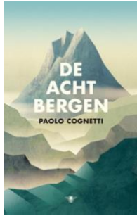
Paolo Cognetti De acht bergen De Bezige Bij, 2017 224 pagina's

Pietro is een stadsjongen uit Milaan. Zijn vader is scheikundige, en gefrustreerd door zijn werk in een fabriek. Zijn ouders delen een liefde voor de bergen, dat is waar ze elkaar ontmoetten, waar ze verliefd werden en waar ze trouwden in een kerkje aan de voet van de berg. Door deze gedeelde passie kan hun relatie voortbestaan, zelfs wanneer tragische gebeurtenissen plaatsvinden. Het stadsleven vervult hun vaak met gevoelens van spijt dat ze niet voor een ander leven hebben gekozen. Dan ontdekken ze een dorpje in het Noord-Italiaanse Valle d'Aosta waar het gezin vanaf dat moment iedere zomer zal doorbrengen. De elfjarige Pietro raakt er bevriend met de even oude Bruno, die voor de koeien zorgt. Hun zomers vullen zich met eindeloze wandelingen door de bergen en zoektochten door verlaten huizen en oude molens en er bloeit een ogenschijnlijk onverwoestbare vriendschap op. De acht bergen betekende voor de Italiaanse auteur Paolo Cognetti (1978) niet alleen zijn doorbraak in Italië maar het boek is ook in Nederland uitzonderlijk goed ontvangen. De vertaalrechten werden bovendien aan meer dan 30 landen verkocht.