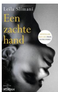
Leïla Slimani Een zachte hand Nieuw Amsterdam, 2017 192 pagina's

Benedict Wells (1984) schreef een grootse liefdesgeschiedenis over het verwerken van verlies en eenzaamheid, en over de vraag wat onveranderlijk is in de mens. Het einde van de eenzaamheid doet toch eerder ontroerend dan zwaarwichtig aan, Het won literaire prijzen en is in Duitsland een bestseller.