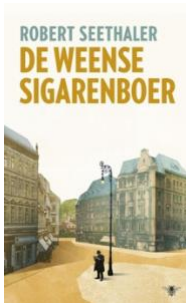
Robert Seethaler De Weense sigarenboer De Bezige Bij, 2017 256 pagina's

Oostenrijk, september 1937. De zeventienjarige Franz Huchel is in een klein gehucht bij zijn alleenstaande moeder opgegroeid. Als de weldoener van zijn moeder onverwacht overlijdt, stuurt zij hem naar Wenen, waar hij een baantje krijgt in een sigaren- annex tijdschriftenzaak, beheerd door Otto Trsnjek, een oude vriend van zijn moeder. Een van Franz' vaste klanten is de hoogbejaarde Sigmund Freud die niet alleen regelmatig langskomt voor sigaren, maar ook kwistig is met adviezen voor het liefdesleven van de jonge Franz.